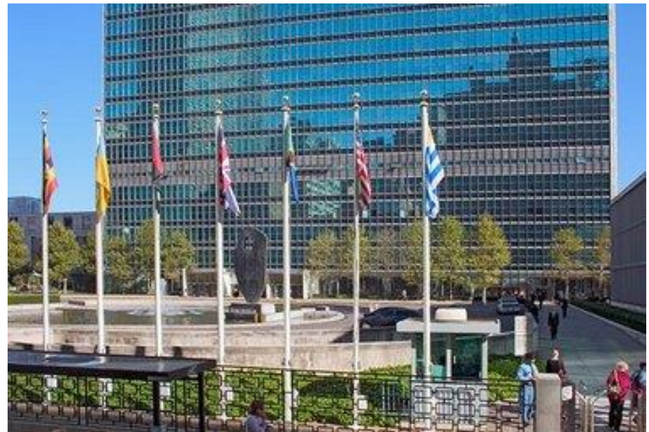
Zgrada UN, New York