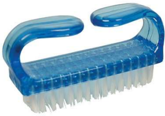
četkica za nokte