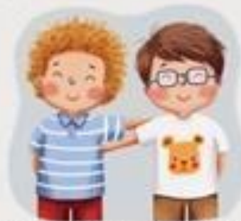
NE GOVORIM RUŽNE RIJEČI I NE TUČEM DRUGE