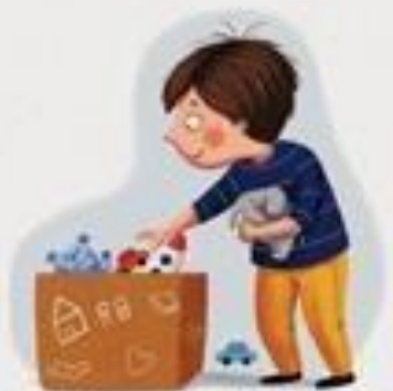
POSPREMAM SVOJE STVARI