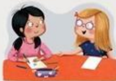
TUĐE STVARI UZIMAM UZ DOPUŠTENJE