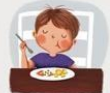
MIRNO SJEDIM ZA STOLOM I ŽVAČEM ZATVORENIH USTA