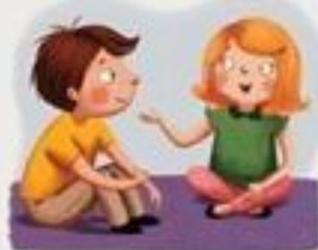
SLUŠAM KAD DRUGI GOVORE