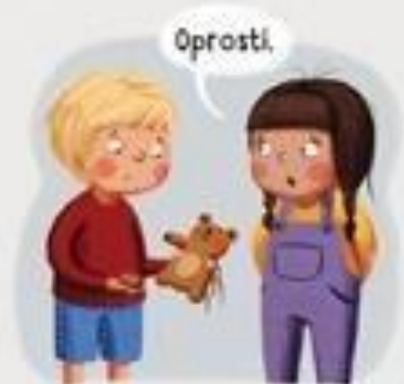
ISPRIČAM SE KAD POGRIJEŠIM