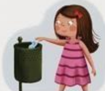
SMEĆE BACAM U KANTU