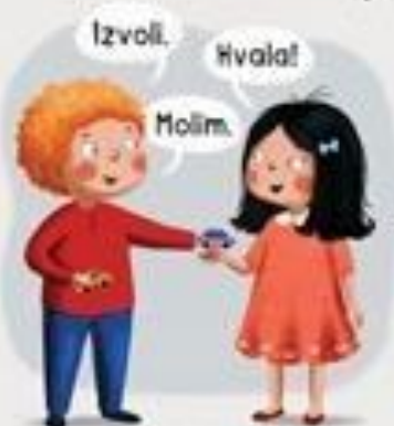
DIJELIM S DRUGIMA