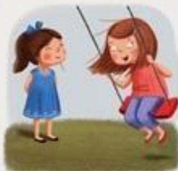
STRPLJIVO ČEKAM SVOJ RED