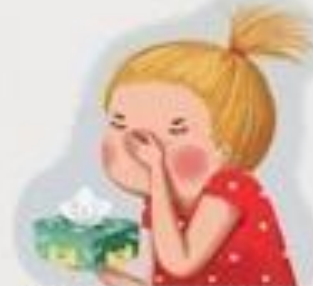
STAVLJAM RUKU KAD KIŠEM ILI KAŠLJEM