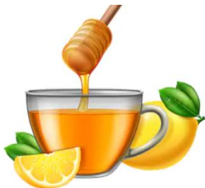
topli čaj s limunom i medom