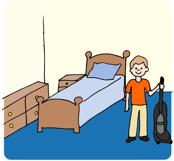
Usiši tepihe u sobi